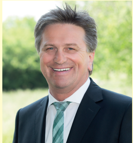
Manne Lucha Mdl

Alles Gute und viel Freude für Sie und Ihre Familie!